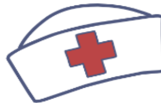
School health services