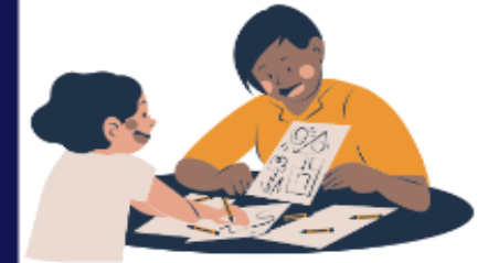
Speech & language services