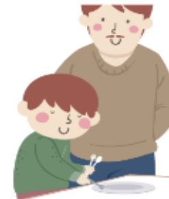
Physical & Occupational Therapy