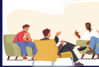
Parent counseling / training