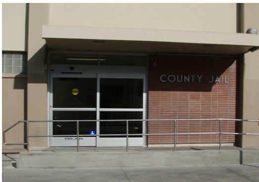
La nueva rampa ya instalada