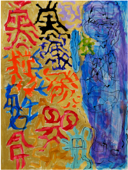
«Storyteller»՝ հեղինակ Շիոլի Հունուցուցարված www.niadapt.com -ում