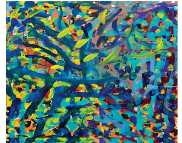
“Untitled” ni Mia Brown na itinatanghal sa www.niadart.com

Kami ay nagtataguyod, nagtuturo, nag-iimbestiga, at naghahabla para isulong at protektahan ang mga karapatan ng mga taga-California na may mga kapansanan.