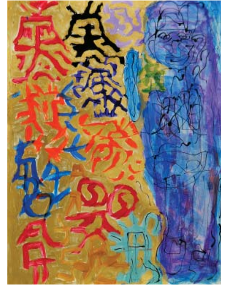
www.niadart.com에 공개된 Shirley How의 "Storyteller"