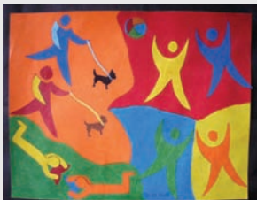
Brenda Stewart의 작품

본 협회의 재정은 장애인에게 서비스를 제공하기 위해 연방 및 주정부 보조금, 개인 기부, 변호사 비용으로 충당되고 있습니다. 우리는 501c(3) 단체입니다.